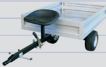
CARRELLO TRAINATO TRAILER ΠΥΜΟΥΛΑΚΑ ΣΥΡΟΜΕΝΗ