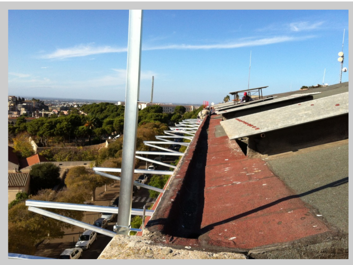
Caserma Carlo Alberto Polizia di Stato (CA) Istallazione Parapetti