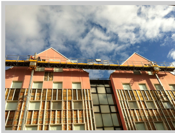
ERSU Casa dello Studente (CA) Noleggio Piattaforme Auto sollevanti Per Bonifica Amianto superficie Mq 6000